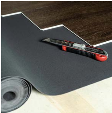
Фото / Схеми: