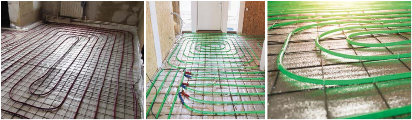
Фото / Схеми: